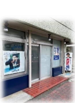
おばた和仁事務所

地域運営組織は、行政を代替する住民主体の地域活動を展開しています。縦割りでない一体型組織であるため、福祉活動や子どもの社会教育、高齢者買い物支援など、地域住民へのワンストップサービスも可能となっています。若い世代が積極的に関わる仕組みも構築しており、大変参考になりました。